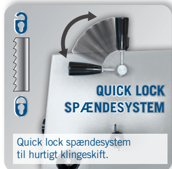
Quick lock spændesystem til hurtigt klingskift.