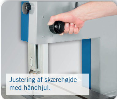
Justering af skærehøjde med håndhjul.