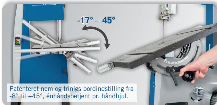
Patenteret nem og trinløs bordindstilling fra -8° til +45°, énhåndsbetjent pr. håndhjul.