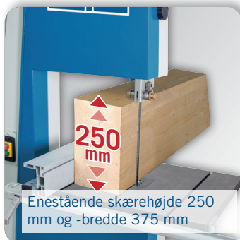
Enestående skærehøjde 250 mm og -bredde 375 mm