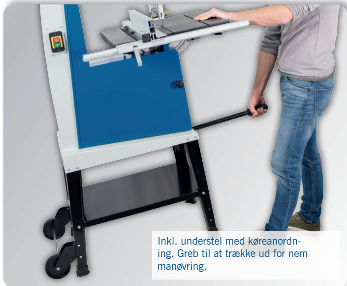
Inkl. understel med køreanordning. Greb til at trække ud for nem manøvrering.