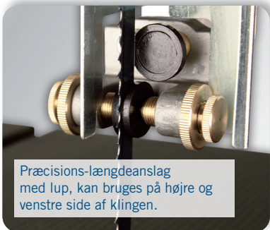
Præcisions-længdeanslag med lup, kan bruges på højre og venstre side af klingens.