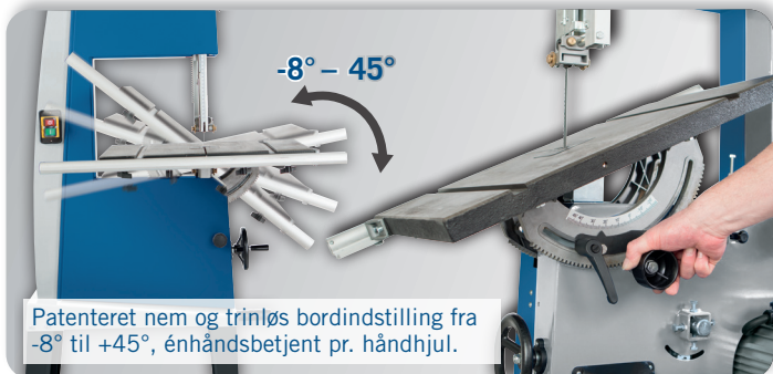
Patenteret nem og trinløs bordindstilling fra -8° til +45°, énhåndsbetjent pr. håndhjul.