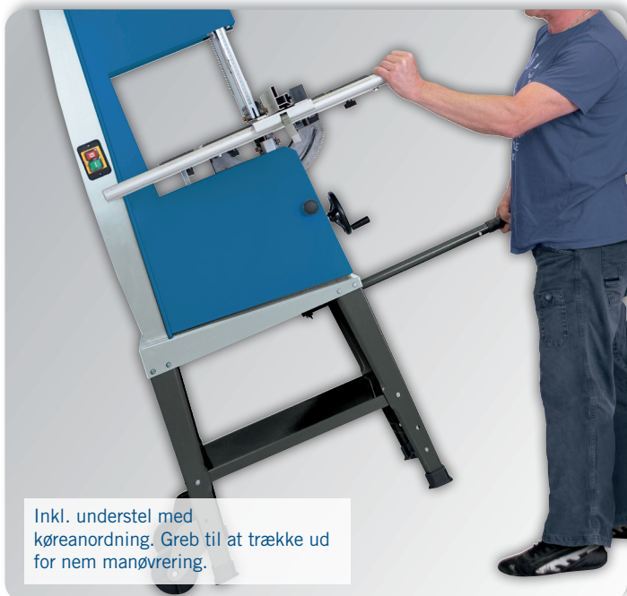
Inkl. understel med køreanordning. Greb til at trække ud for nem manøvrering.