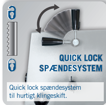
Quick lock spændesystem til hurtigt klingskift.