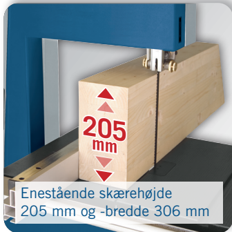
Enestående skærehøjde 205 mm og -bredde 306 mm